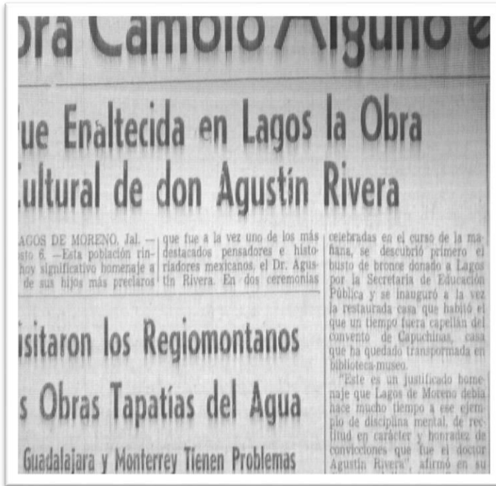
Nota del Periódico El Occidental , informando sobre el Homenaje al Laguense Agustín Rivera.