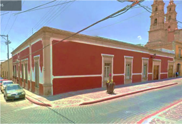
Imagen de casa habitada por Pedro Moreno ubicada en calle que hoy lleva su nombre esquina con calle Lic. Primo de Verdad y Ramos