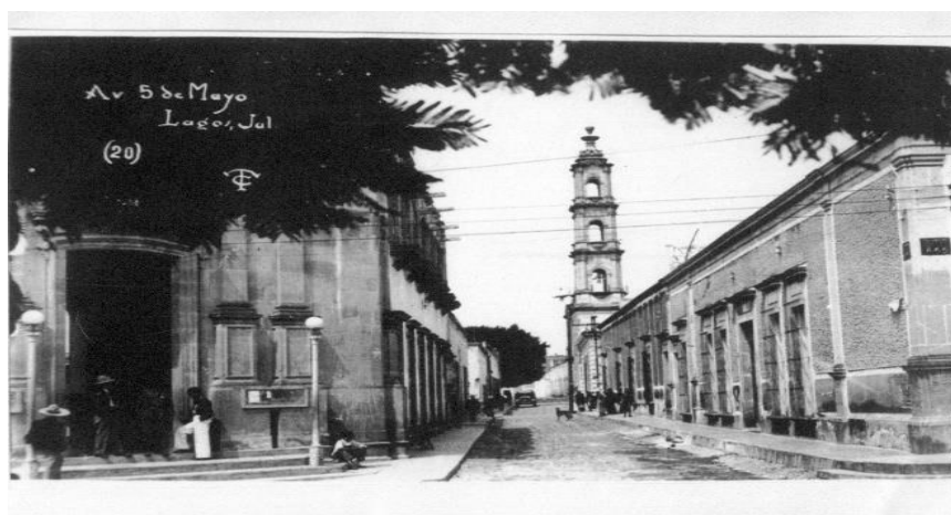
Arreglo de adoquinado en callejón Francisco González León.