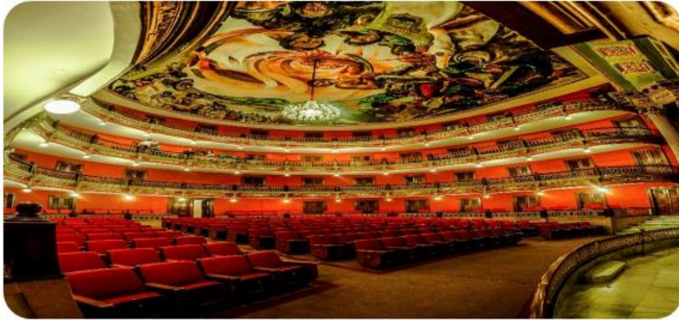
El nacimiento del Estado libre de Jalisco hace 201 años