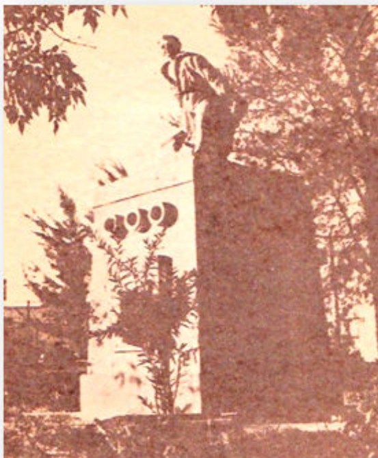
Monumento erigido a Pedro Moreno un 4 de agosto de 1951 en la Calzada que lleva su nombre