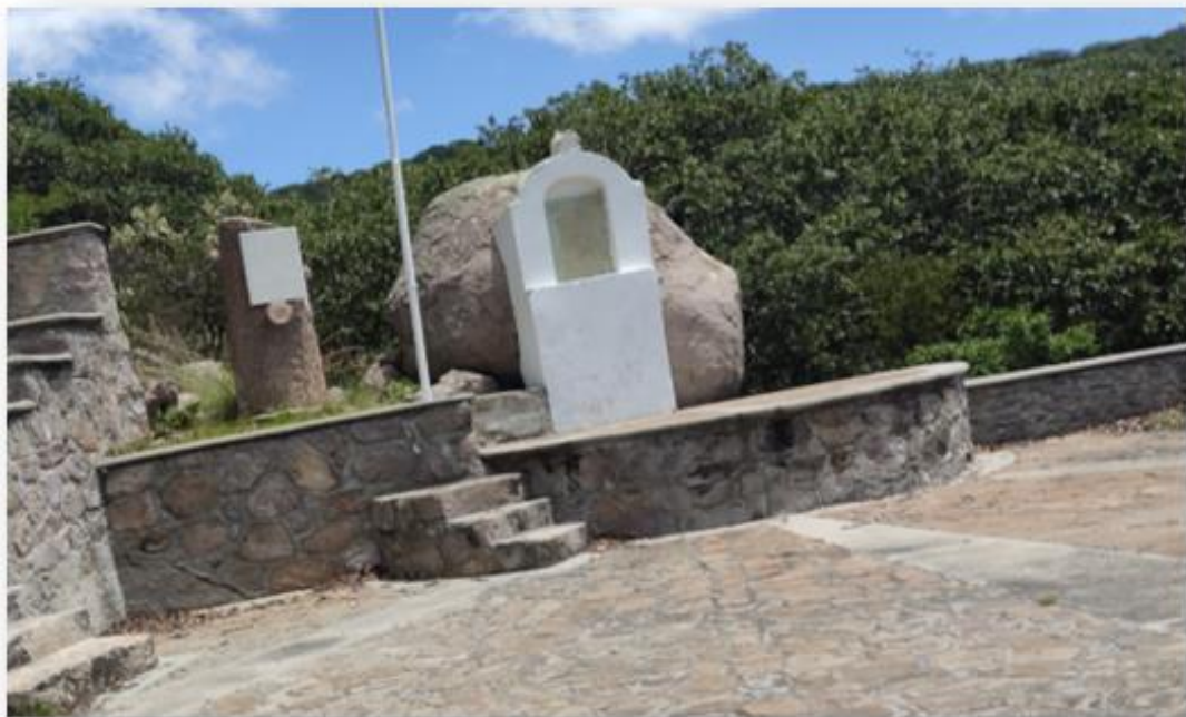
Plaza cívica construida en honor al insurgente Pedro Moreno en el lugar donde murió.

27 de octubre, en la noche. Pascual Moreno, hermano de don Pedro, y tres acompañantes, encuentran el cuerpo del héroe laguense después de haber sido asesinado.