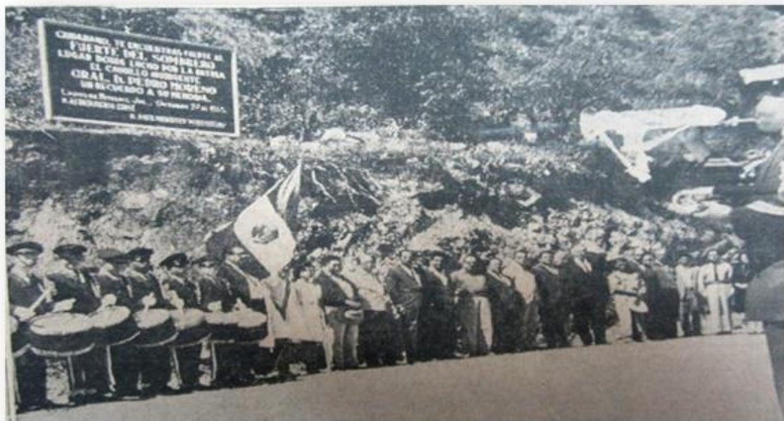
Ceremonia de la develación de la Placa sobre la falda del cerro del Fuerte del Sombrero, por los Ayuntamientos de Lagos de Moreno y León.