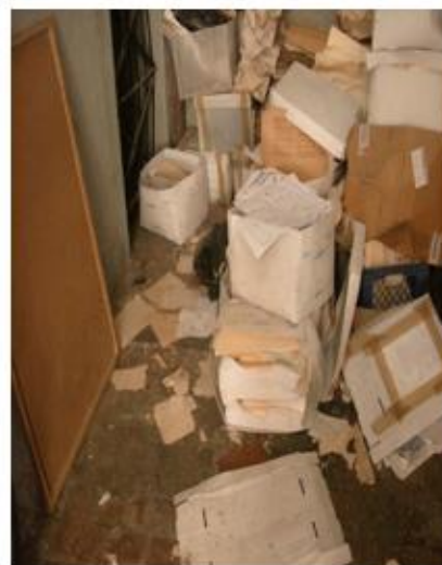
Fotografías del Archivo Judicial Cárcel de Mujeres