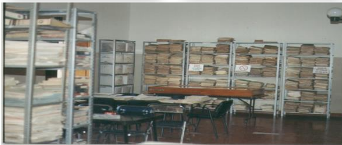
Fotografía del Archivo Histórico del Ayuntamiento de Lagos de Moreno en su inauguración.