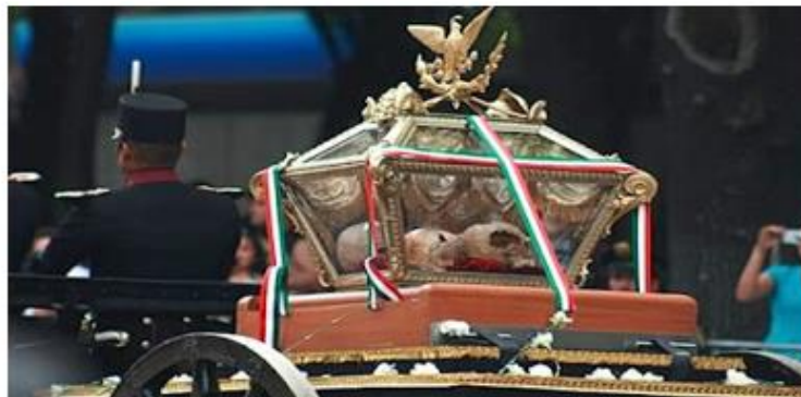
Traslado de restos de restos héroes de la patria al Ángel de la Independencia

Hace 200 años, de acuerdo al decreto 344 en su punto número 12 se menciona que “El congreso declara beneméritos de la patria en grado heroico, á los Sres. D. Miguel Hidalgo, D. Ignacio Allende, D. Juan Aldama, D. Mariano Abasolo, D. José María Morelos, D. Mariano Matamoros, D. Leonardo y D. Miguel Barvo, D. Hermenegildo Galena, D. José Mariano Jiménez, D. Francisco Xavier Mina, D. Pedro Moreno y D. Víctor Rosales: sus padres, mujeres é hijos, y asimismo las hermanas de los Sres. Allende, Morelos, Hidalgo y Matamoros, gozarán de la pensión que les señalará el supremo poder ejecutivo, conforme á los extraordinarios servicios que prestaron, guardándose el orden de preferencia que previene en el artículo 10.” Es por ello que en el presente mes hacemos honor a este destacado lagunense cuyos méritos y sacrificios por la patria le valieron este nombramiento a la par de los más destacados personajes que participaron en la gesta independentista de nuestro país.