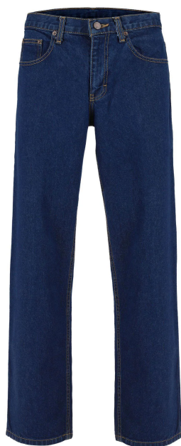
Pantalón de hombre de mezclilla color azul marino.