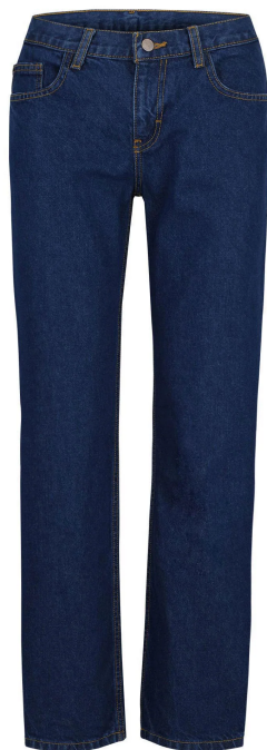
Pantalón de mujer de mezclilla color azul marino stretch.